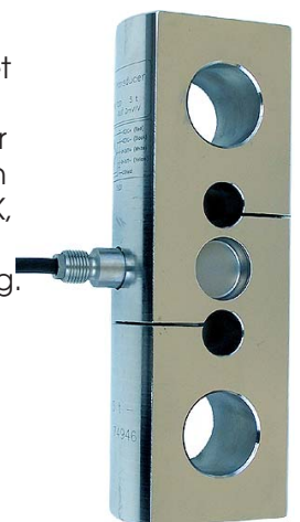
T20 5,10 & 20t

DFI instrumentet er meget velegnet til transportabel vejning og test formål, kan leveres med vejeceller fra 5kg træk som vist op til 100ton træk celler, har standard +/- PEAK, kan skifte mellem kg, t, N, kN. 16mm høje display med +/- visning. Kan også leveres med RS232 udgang samt software for data til Excel.